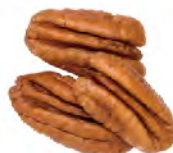
Jr. Mammoth Halves 250-300 per lb. 550-660 per kg.