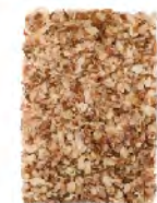
Meal Thru 5/64" screen Thru 2.0mm screen