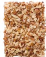
Granule Thru 8/64" screen over 5/64" Thru 3.2mm screen over 2.0mm