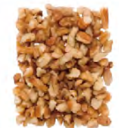
Midget Pieces Thru 12/64" screen over 8/64" Thru 4.8mm screen over 3.2mm