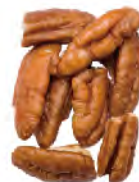
Extra Large Pieces Thru 3/64" screen over 28/64" Thru 14.3mm screen over 11.1mm