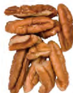
Large Pieces Thru 28/64" screen over 19/64" Thru 11.1mm screen over 7.5mm