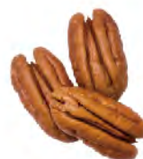
Jumbo Halves 300-350 per lb. 660-770 per kg.