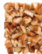
Small/Medium Pieces Thru 19/64" screen over 16/64" Thru 7.5mm screen over 6.4mm