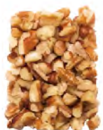
Small Pieces Thru 16/64" screen over 12/64" Thru 6.4mm screen over 4.8mm