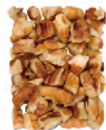
Medium Pieces Thru 22/64" screen over 16/64" Thru 8.7mm screen over 6.4mm