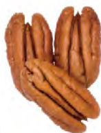
Mammoth Halves 200-250 per lb. 440-550 per kg.