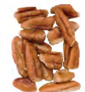
Large/Medium Pieces Thru 26/64" screen over 19/64" Thru 10.3mm screen over 7.5mm